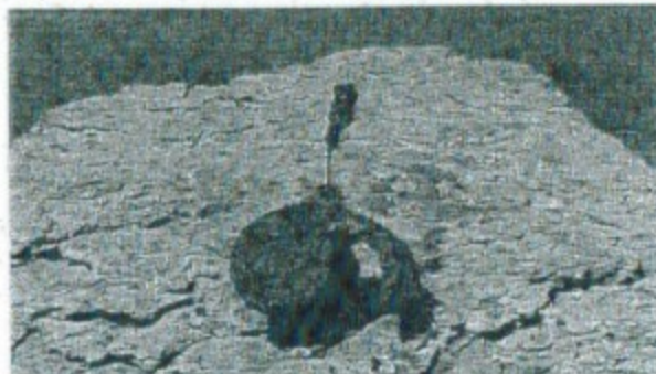
Uno degli ordigni rinvenuti in riva al Po

Si tratta di mine anti-uomo inesplose di fabbricazione tedesca