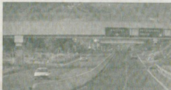
Perugia - Ancona | ritardi connessi al tratto di Valfabbrica

GUALDO TADINO - La vicenda del taglio delle fermate di Fossato di Vico, il della Orte-Falconara e di quella della Perugia-Ancona via Flaminia non ancora sono alcuni degli argomenti mercoledì pomeriggio del convegno "Visibilità del territorio", promosso dal Comune di Gualdo Tadino è svolto presso la sala del municipio. All'evento era presente l'assessore regionale ai trasporti, Giuseppe Mascio, e l'amministrazione di Gualdo Tadino. La vicenda del taglio delle fermate di Fossato di Vico, che nel corso dell'anno ha infuocato la discussione con tanto di blocchi da parte dei sindaci, avrà una tappa fondamentale la prossima settimana a Roma. Nella capitale